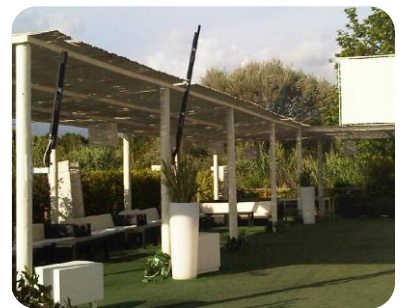
Esempi di sonorizzazione perfettamente integrata con l'ambiente.