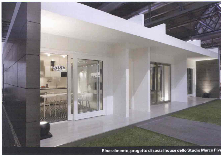
Rinascimento, progetto di social house dello Studio Marco Piva

Proprio per trasferire ai visitatori il concetto che design, stili, materiali e prodotti italiani possono essere di riferimento per progetti di Social Housing belli a basso costo, lo Studio Marco Piva con Rinascimento e lo Studio Luca Scacchetti con la Casa degli Sguardi hanno ideato due veri e propri appartamenti prefabbricati; lo Studio Pierandrea Associati, invece, ha presentato il progetto di My Lane, un centro fitness