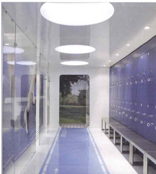
My Lane, centro fitness collettivo dello studio Pierandrei Associati

Marelli Studio ha dato vita a una Nature Lounge con l'intento di sensibilizzare l'uso di materiali naturali per l'architettura, ma anche l'impiego di un'alimentazione sana e un ritorno alla natura per un utilizzo più consapevole delle risorse del pianeta.