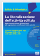
La liberalizzazione dell'attività edilizia