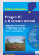
Pregeco 10 e il catasto terreni