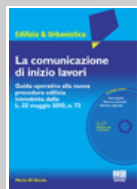
La comunicazione di inizio lavori