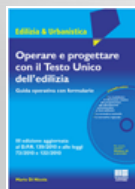
Operare e progettare con il T.U. dell'Edilizia